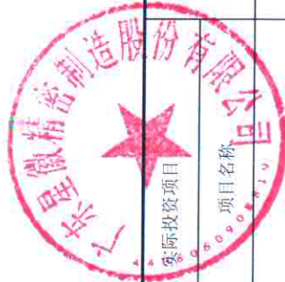
前次募集资金投资项目实现效益情况对照表